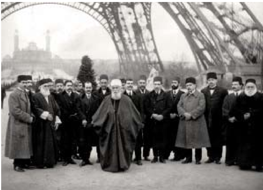
'Abdu'l-Bahá y algunos seguidores bajo la Torre Eiffel de París, en 1912