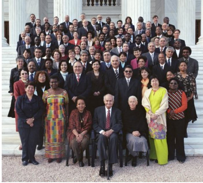
Cuerpo Continental de Consejeros 2005