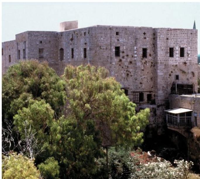
La prisión de 'Akká, en la Tierra Santa, Israel Donde Bahá'u'lláh fue encarcelado por dos años.

También dice Él, "La Antigua Belleza (Bahá'u'lláh) ha asentido ser encadenado para que la humanidad pueda ser liberada de su cautiverio, y ha aceptado que le hicieran prisionero dentro de esta poderosísima Fortaleza para que el mundo entero pueda lograr la verdadera libertad. Ha probado hasta la saciedad la copa del dolor, para que todos los pueblos de la tierra puedan obtener un regocijo duradero y llenarse de felicidad." (Pasajes de los Escritos de Bahá'u'lláh)