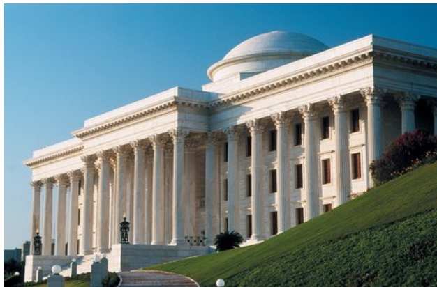
Sede de la Casa Universal de Justicia, Haifa, Israel