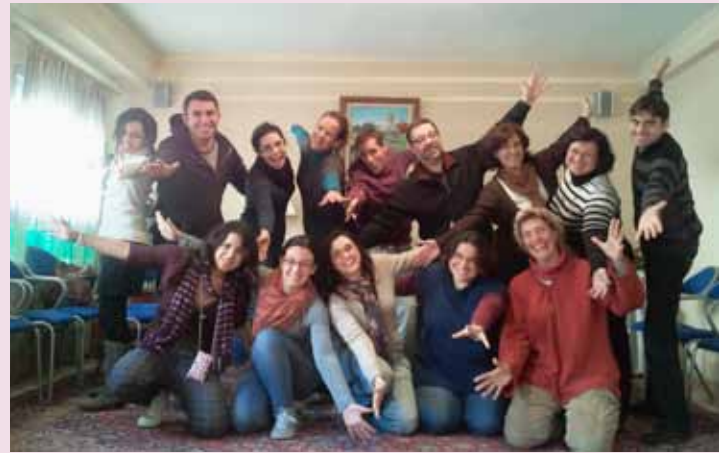
Los coordinadores del Este reunidos en Valencia