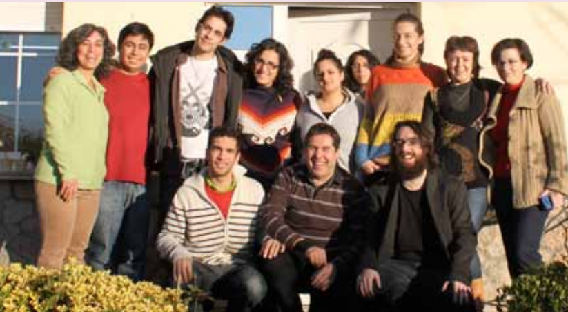
Los coordinadores del norte reunidos en Asturias

El fin de semana del 7 al 9 de diciembre se celebraron en Asturias y Valencia sendos seminarios de coordinadores del ámbito regional al que asistían también, además de los miembros de la junta, los miembros del cuerpo auxiliar y los jóvenes en año de servicio.