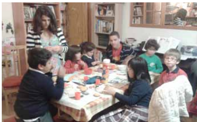
Grupo de prejóvenes

Ya en abril, se vio la posibilidad de crear un grupo prejuvenil con las chicas de mayor edad que asistían a las clases de niños, algunas de las cuales ya tenían 11 años, de modo que fuera un puente para comenzar el siguiente curso con el programa de prejóvenes. Las chicas hablaron con los compañeros de clase con los que les gustaría crear un grupo y nosotros nos encargamos de hacer lo propio con los padres de los chavales del barrio, invitándolos a todos, hijos y padres, a una merienda y presentación de la actividad, ya entrados en mayo. Acudieron bastantes personas y todas quedaron encantadas con el propósito del grupo, la orientación hacia los actos de servicio y el hecho de que fueran ellos mismos los propios artífices de su evolución. Se comenzó con alegría y convencimiento, y unos invitaron a otros para las sesiones siguientes, por lo que la animadora echó mano de otros dos amigos