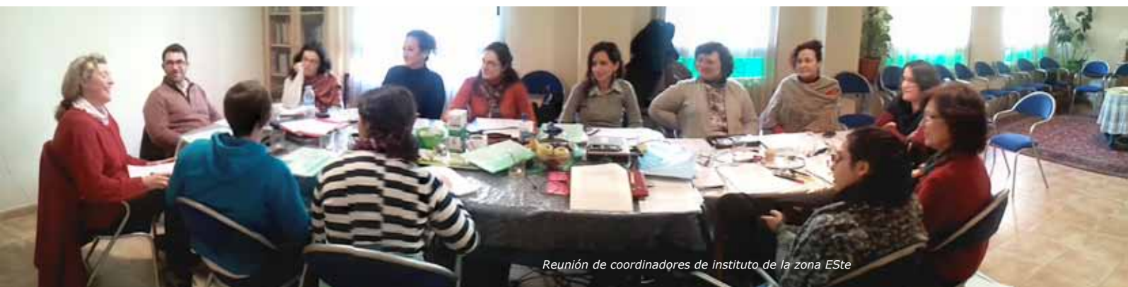
Reunión de coordinadores de instituto de la zona ESTe

Los acontecimientos ocurridos desde entonces tan sólo han venido a demostrar aún más la eficacia de una