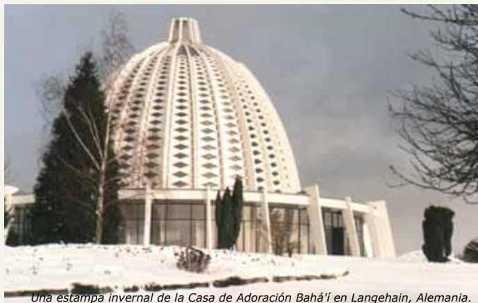
Una estampa invernal de la Casa de Adoración Bahá'í en Langehain, Alemania.

El Ministerio de Asuntos Religiosos del land (estado federal) de Hesse, concede a la Comunidad Bahá'í de Alemania el reconocimiento de ser un organismo oficial. Así lo ha decidido el Tribunal Administrativo Federal de Leipzig, rechazando la apelación del gobierno estatal de Hesse contra la sentencia del Tribunal Administrativo de la ciudad de Kassel.